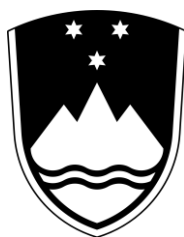
Črno-beli grb (varianta 2)